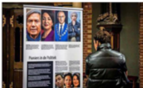
De expositie reist dit jubileumjaar nog de stad door.

Vanaf de jaren zestig kwamen Marokkaanse mannen naar Nederland als gastarbeiders. In de jaren zeventig volgden hun gezinnen. Op de tentoonstelling staat dit fenomeen centraal. Van de slechte huisvesting in pensions, tot een hongerstaking voor verblijfsvergunningen en de eerste verenigingen